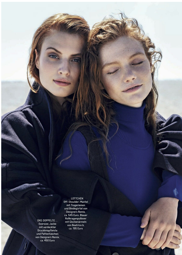
...LÖTTCHEN Diff-Shoulder-Mantel mit Tragearmen und Bindegürtel von Designers Remik, ca. 545 Euro. Blauer Rollkragenspullover mit Glockenärmeln von Beatrice, b., ca. 195 Euro DAS DOPPELLE... Oversize-Jacke mit verdeckter Druckknopfleiste und Pattentaschen von Designers Remik, ca. 450 Euro