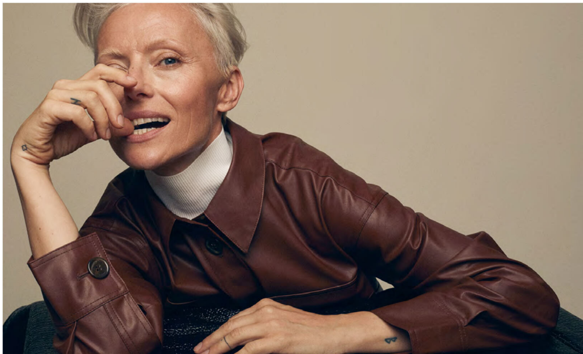
Turtleneck: Joseph @josephfashion, Faux Leather Dress: Designers Remix @designersremix