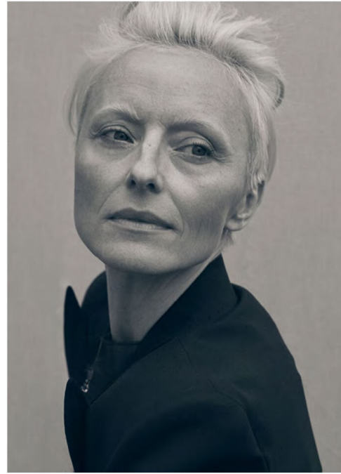
Blazer: Paul Smith @paulsmithdesign, Leo Top: Dawid Tomaszewski @dawidtomaszewski