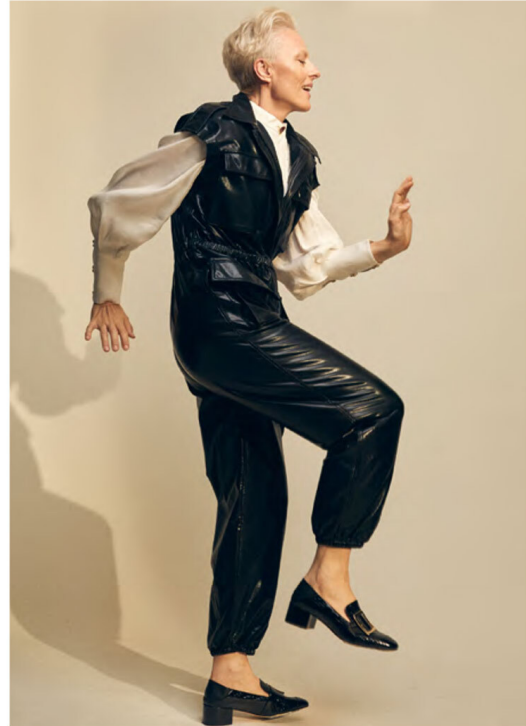
Jumpsuit: Norma Kamali @normakamali, White Shirt: AJE @_aje_, Loafers: Bally @bally