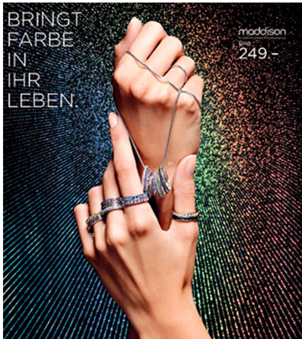
MADDISON: 01 RING Weiss-/Gelbgold, 18 Karat, mit synth. Zirkonas, diverse Farben, je 249.- (ohne Kette) | 02 RING Weiss-/Gelbgold, 18 Karat, mit synth. Zirkonas, diverse Farben, je 299.- MANOR 29