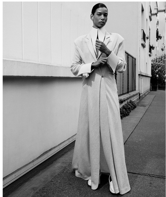
modell No. 1.2026

Die exzentrische Adelsfamilie aus dem Film «Saltburn» inspirierte zu aristokratischen Looks, die morbide Strenge der Oberschicht nun auf die Strasse bringen.