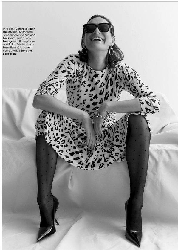
Maxikleid von Polo Ralph Lauren über Myrthesch. Sonnenbrille von Victoria Beckham. Pumps von Ferragamo. Strumpfhose von Falke. Ohrringe von Pomellato. Gliederarmband von Marjana von Berlepsch

HEIGHT 175 cm BUST/WAIST/HIPS 85/67/97 cm EYES brown HAIR brown SHOES 40 LOCATION Hamburg DE