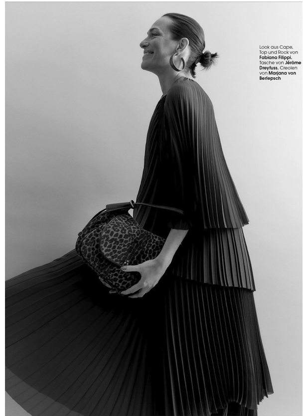
Look aus Cape. Top und Rock von Fabiana Filippi. Tasche von Jérôme Dreyfuss. Creolen von Marjana von Berlepsch

Auffällige Muster mit Nudetönen und neutralen Basics kombinieren